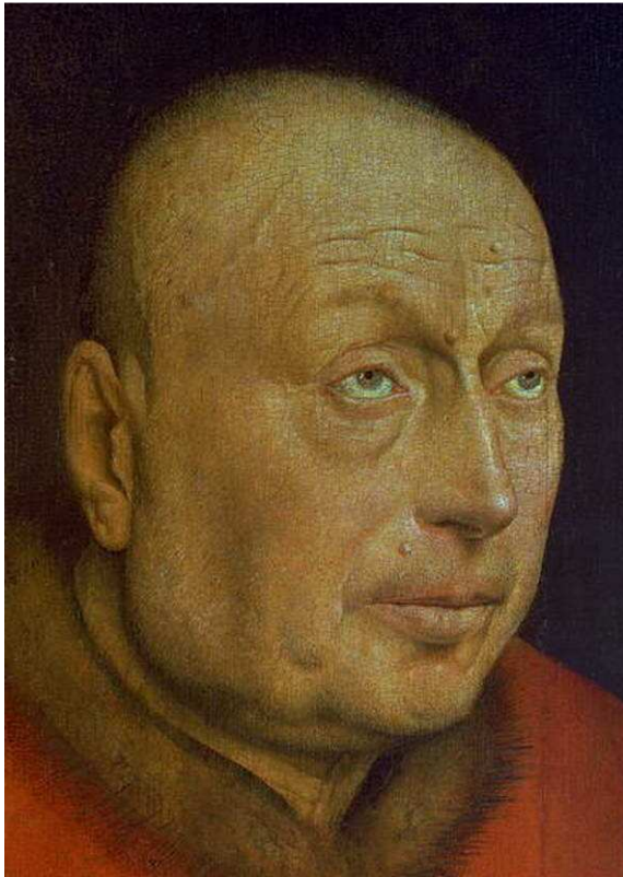
Fig.4. Jan Van Eyck. Lam Gods. Gent, Sint-Baafskathedraal. Jacobus Vijd. Cellulaire naevi in het gelaat. Tumorale opzetting van de linker angulus mandibulae en twee koepelvormige tumoren op het voorste derde van de rechter ramus mandibulae.

Hier gaat het om een dieper liggend proces, dat waarschijnlijk in verband staat met tandcaries.