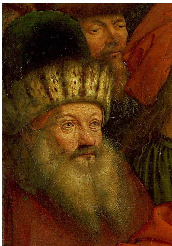
Fig.1. Jan Van Eyck. Lam Gods. Gent, Sint-Baafskathedraal. Centrale paneel, detail profeten. Actinische elastose met miliumcysten en comedonen bij de persoon links. Pigmentnaevus op de neustop bij de rechter persoon.

Chronisch eczeem gaat gepaard met lichenificatie . Hieronder verstaat men een accentuering van de huidtekening, zodat de huidoppervlakte grof en ruw wordt. Dit kan gezien worden op de afbeelding van Sint Antonius die met de bel in de hand op het linker zijpaneel van het Portinari triptiek weergegeven is. De huid van de pols en van de handrug is verdikt en de huidtekening is er versterkt. De heilige lijdt tevens aan chronisch rheuma met zwelling van de metacarpophalangeale en interphalangeale gewrichten.