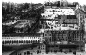
Hof van Brabant - Coudenberg